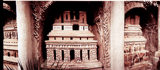
Miniatyr i en alkov på Palais Idéal, föreställande Maison Carré i Alger. Cheval påstod att han hade rest i Nordafrika i sin ungdom, men allt tyder på att det är lög.

– Den där? Den har Cheval hämtat från några grottor fyra kilometer härifrån. Jag kan köra dig dit om du vill, säger han.