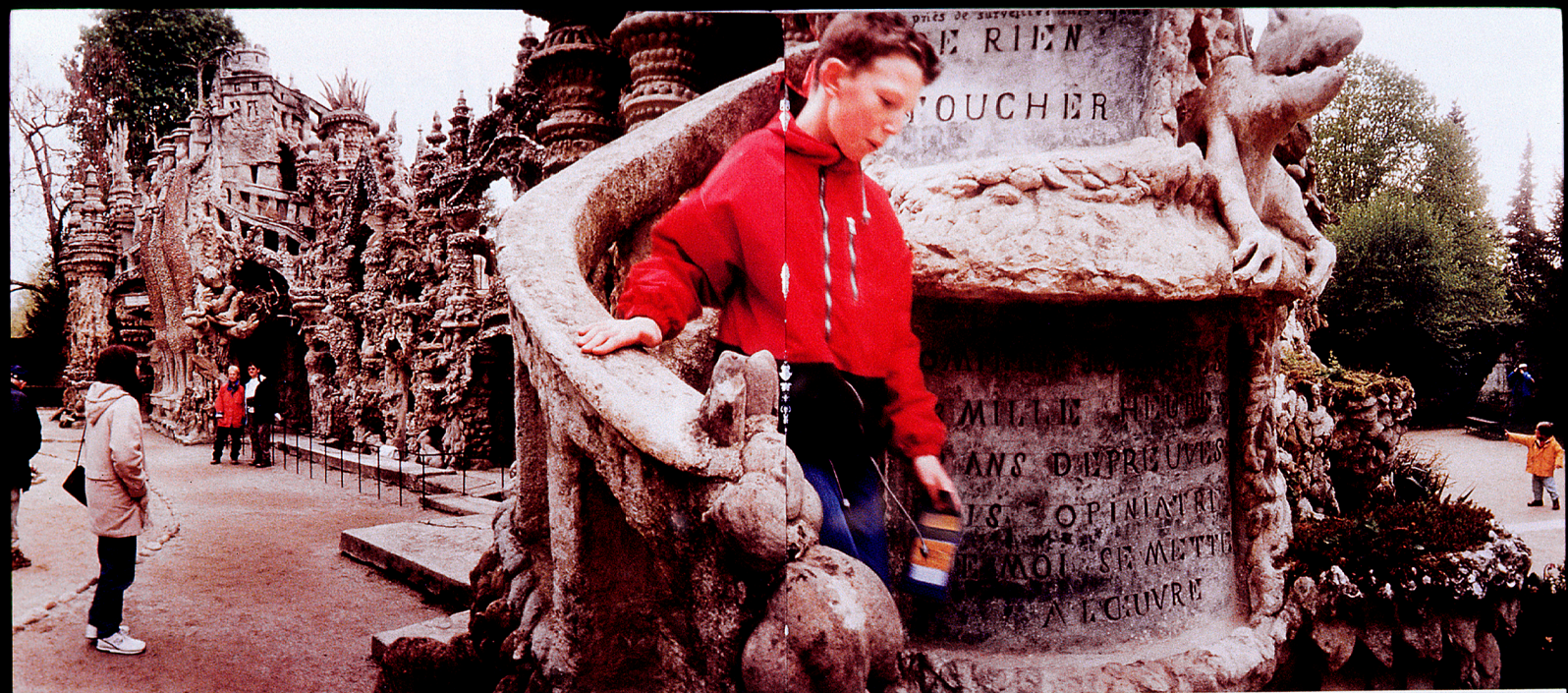
Kontemplation. En lugn dag vid Palais Idéal. Folk går andäktiga omkring, men stannar för kort tid, enligt directeur Cambrillat.

för byns kyrkogård. Så 1914, vid 78 års ålder, tog Cheval upp murslaven igen; i åtta år arbetade han med att skapa ett gravmonument åt sig och sin familj på kyrkogården.