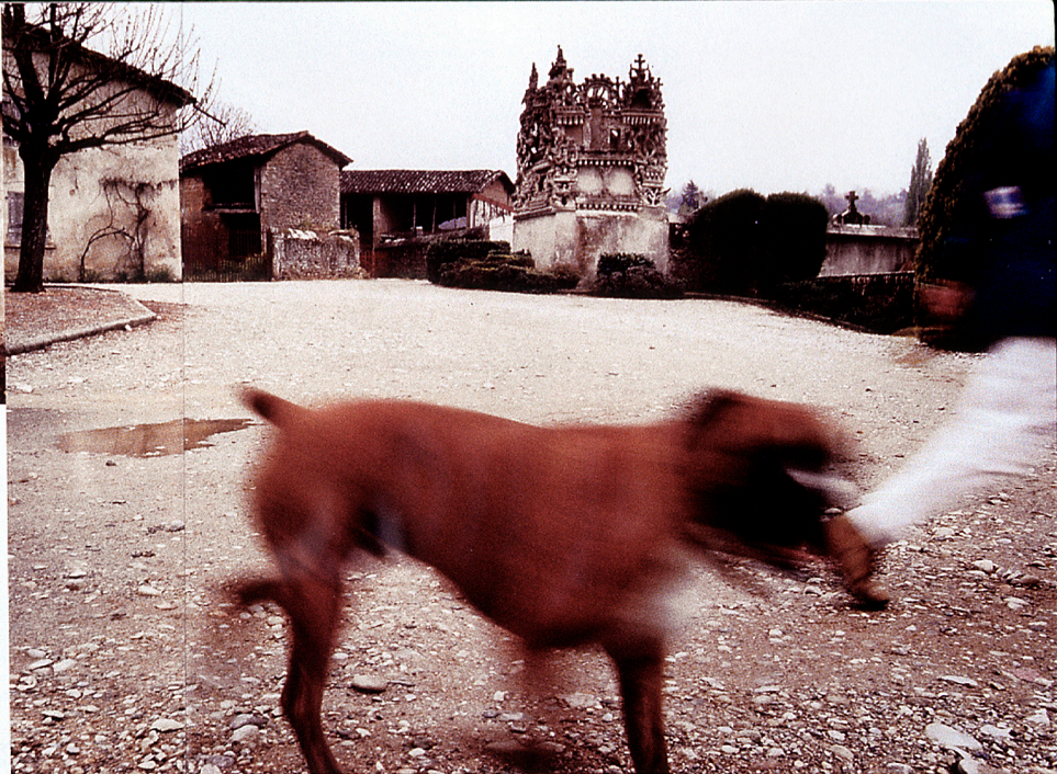
Minnesmarsch. Folk och få går i brevbärarens fotspår. I bakgrunden familjen Chevalls gravmonument som tog åtta år att bygga.

Det skulle dröja tio år innan hans palats fick sitt första genombrott. I mitten av 20-talet upptäckte surrealisterna