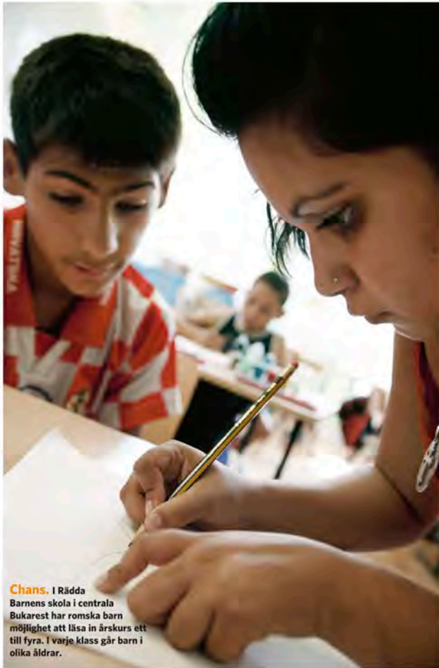
Chans. I Rädda Barnens skola i centrala Bukarest har romska barn möjlighet att läsa in årskurs ett till fyra. I varje klass går barn i olika åldrar.

På Rädda Barnens skola försöker personalen även hjälpa barnen att ordna fram