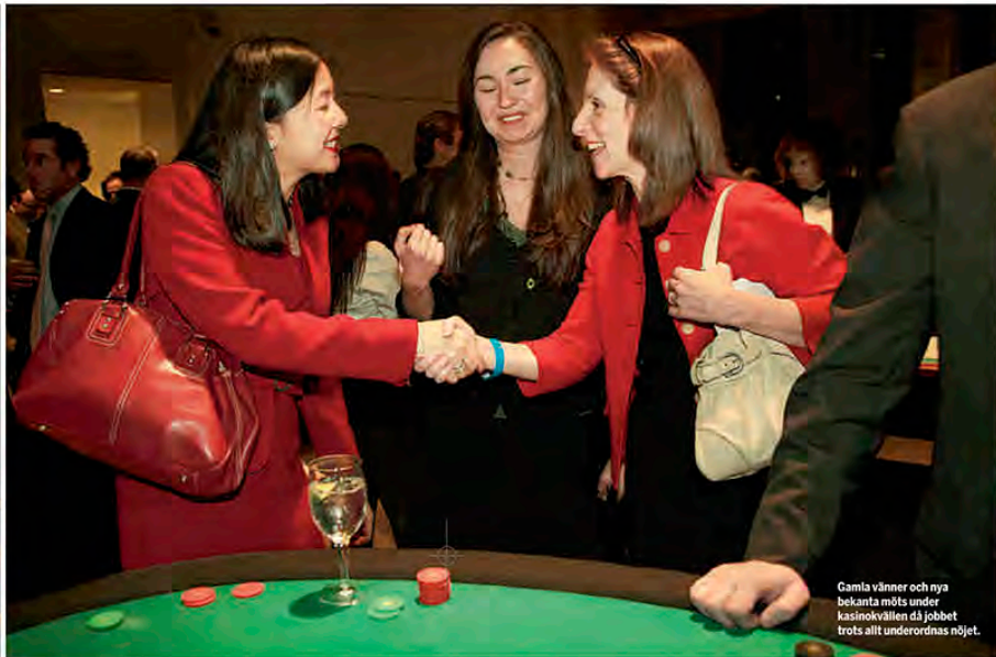
Gamla vänner och nya bekanta möts under kasinokvällen då jobbet trots allt underordnas nöjet.