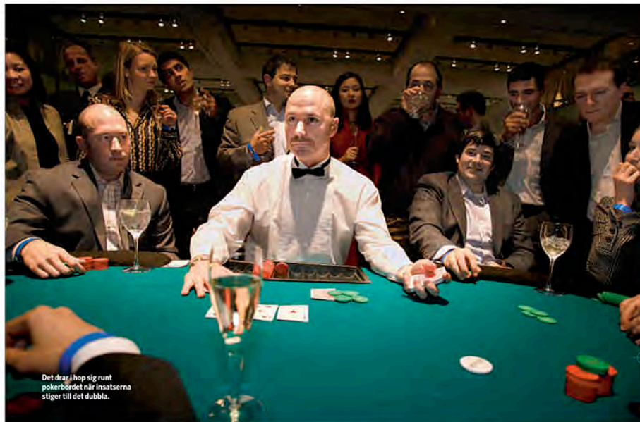
Det drag i hop sig runt pokerbordet när insatserna stiger till det dubbla.