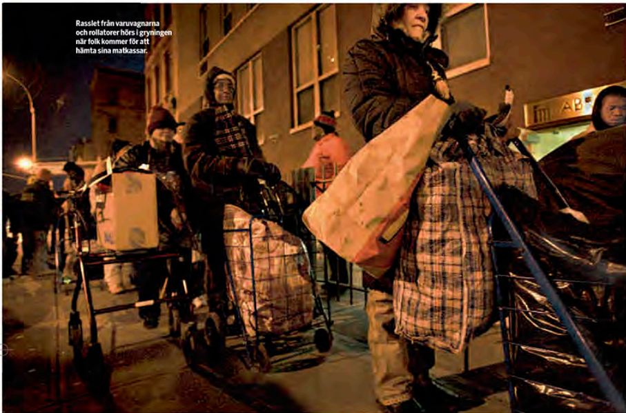
Rasslet från varuvagnarna och rollatorer hörs i gryningen när folk kommer för att hämta sina matkassar.

president Ronald Reagan stora sociala nedskärningar på drygt 700 miljarder kronor. Man strök inom alla områden: inkomstbidrag, hälsovård, bostadsbidrag, arbetslöshetsersättning och hjälp med matkuponger, food stamps, åt dem som hade det sämst.