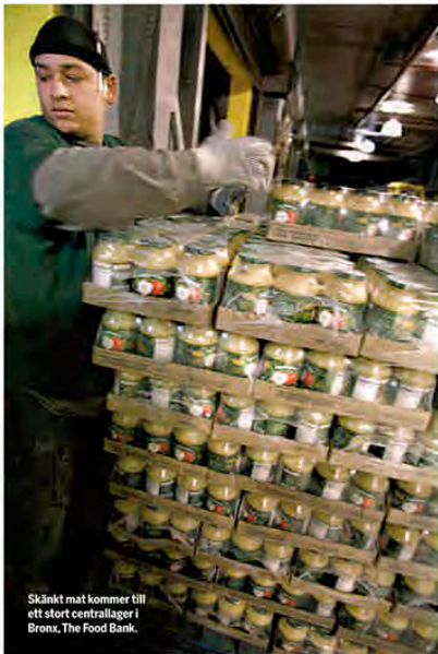
Skänkt mat kommer till ett stort centrallager i Bronx, The Food Bank.

project, och från rucklen på smågatorna. Tysta människor skjuter rasslande varuvagnar framför sig och bär på tomma väskor och korgar. Många är hispanics, mest mexikaner, några är afroamerikaner.